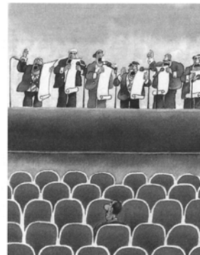
Karikaturist: Ali Farzat